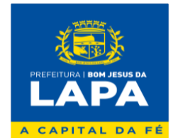
Fabio Nunes Dias Prefeito Municipal CONTRATANTE

PREFEITURA MUNICIPAL DE BOM JESUS DA LAPA – BA Rua Marechal Floriano Peixoto, nº 208 - Sala de Licitação - 1º Andar – Centro – Bom Jesus da Lapa/Ba – Cep: 47.600-000. CNPJ: 14.105.183/0001-14 E-mail: licitacao@bomjesusdalapa.ba.gov.br Tel: (77) 3481-3374 – ramal 216