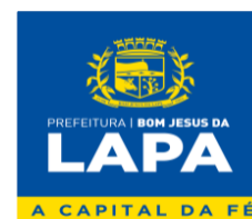
Fabio Nunes Dias Prefeito Municipal Contratante

PREFEITURA MUNICIPAL DE BOM JESUS DA LAPA – BA Rua Marechal Floriano Peixoto, nº 208 - Sala de Licitação - 1º Andar – Centro – Bom Jesus da Lapa/Ba – Cep: 47.600-000. CNPJ: 14.105.183/0001-14 E-mail: licitacao@bomjesusdalapa.ba.gov.br Tel: (77) 3481-3374 – ramal 216