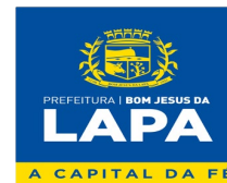
TABELA II ROMARIA BOM JESUS e N.SRA. SOLEDADE ANEXO AO DECRETO N.º. DE 07 DE JULHO DE 2023

PREFEITURA MUNICIPAL DE BOM JESUS DA LAPA – BA Rua Mal. Floriano Peixoto, nº 208 – Centro - Bom Jesus da Lapa – BA, CEP: 47.600-000. CNPJ: 14.105.183/0001-14 (77) 3481-3374