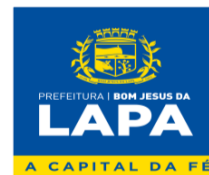
Prefeito Municipal Contratante

PREFEITURA MUNICIPAL DE BOM JESUS DA LAPA – BA Rua Marechal Floriano Peixoto, nº 208 - Sala de Licitação - 1º Andar – Centro – Bom Jesus da Lapa/Ba – Cep: 47.600-000. CNPJ: 14.105.183/0001-14 E-mail: licitacao@bomjesusdalapa.ba.gov.br Tel: (77) 3481-3374 – ramal 216