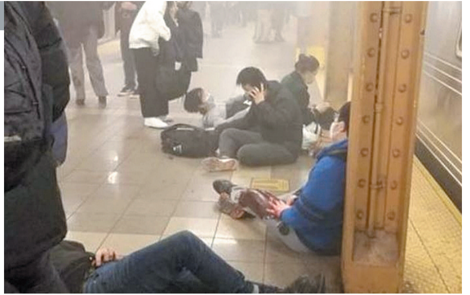
Ao todo, 29 pessoas foram hospitalizadas após o crime. Cinco estão em quadro crítico

O atirador disparou granadas de fumaça em um vagão do metrô lotado e, em seguida, fez pelo menos 33 disparos com uma pistola