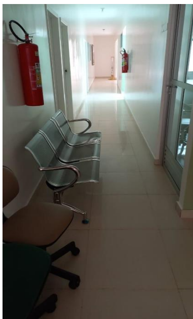
Imagem 04 – Corredor de acesso aos gabinetes