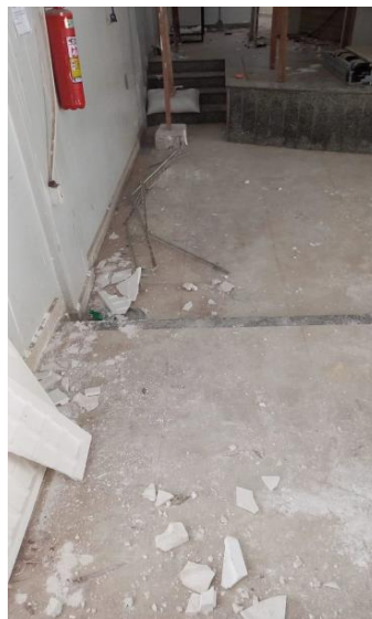
Imagem 11 – locação da rampa de acesso a plenária.