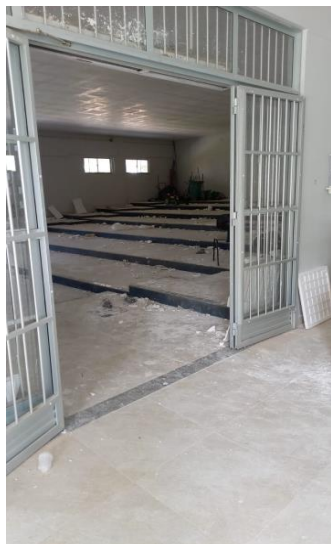
Imagem 10 – Porta de entrada do auditório.

Câmara Municipal de Guanambi CENTRO ADMINISTRATIVO CEP 46430-000 - ESTADO DA BAHIA