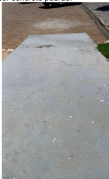
Imagem 01 – Rampa de acesso principal danificada e sem direcionamento tátil.

Devera ser aplicada pintura em tinta para piso sobre toda a área da rampa, na cor concreto padrão.