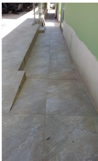
Imagem 06 – Acesso a rampa do auditório.

Ao fundo do prédio dos gabinetes deverá ser aplicada uma faixa de piso tátil que direcione os usuários da porta de saída até o início da rampa que dá acesso ao auditório e plenária da Casa.