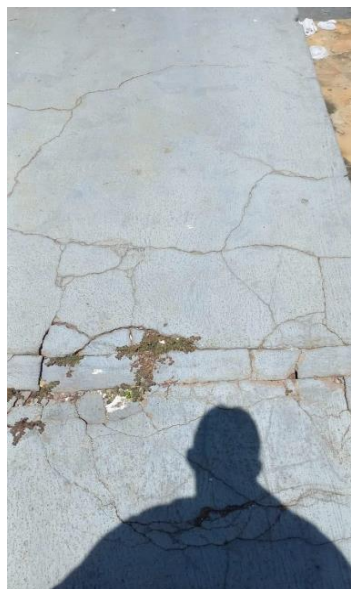
Imagem 02 – Rampa de acesso principal danificada e sem direcionamento tátil.