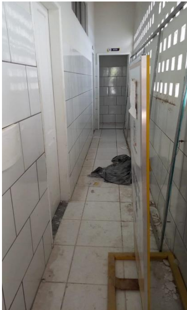
Imagem 09 – Acesso aos banheiros e copa do auditório.

O acesso e o direcionamento aos aparelhos deverão ser instalados de forma correta e como manda os requisitos normativos vigentes.