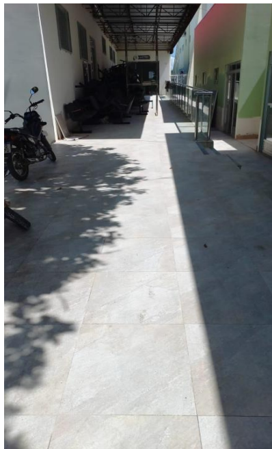
Imagem 07 – Rampa de acesso ao auditório.