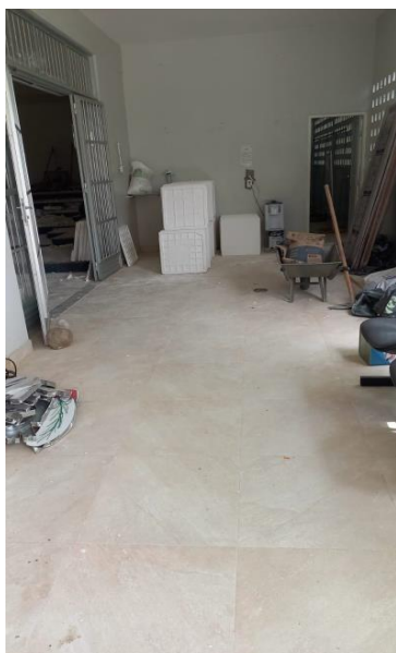
Imagem 08 – Hall de entrada do auditório.

Deverá ser instalada o piso tátil que direcione os usuários para o acesso ao auditório, aos banheiros e copa do auditório e identifiquem todas as mudanças de direção e portas do ambiente.