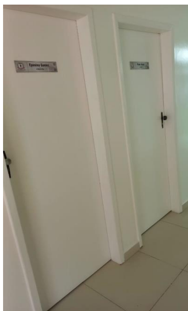
Imagem 12 – Portas sem identificação em braile.

No auditório, sala do presidente, e sala de reunião deverá ser instalada uma placa com 25x15 cm de dimensões. Nas demais salas, banheiros e acessos, deverá ser instaladas 27 placas com dimensões iguais a 28x8 cm.