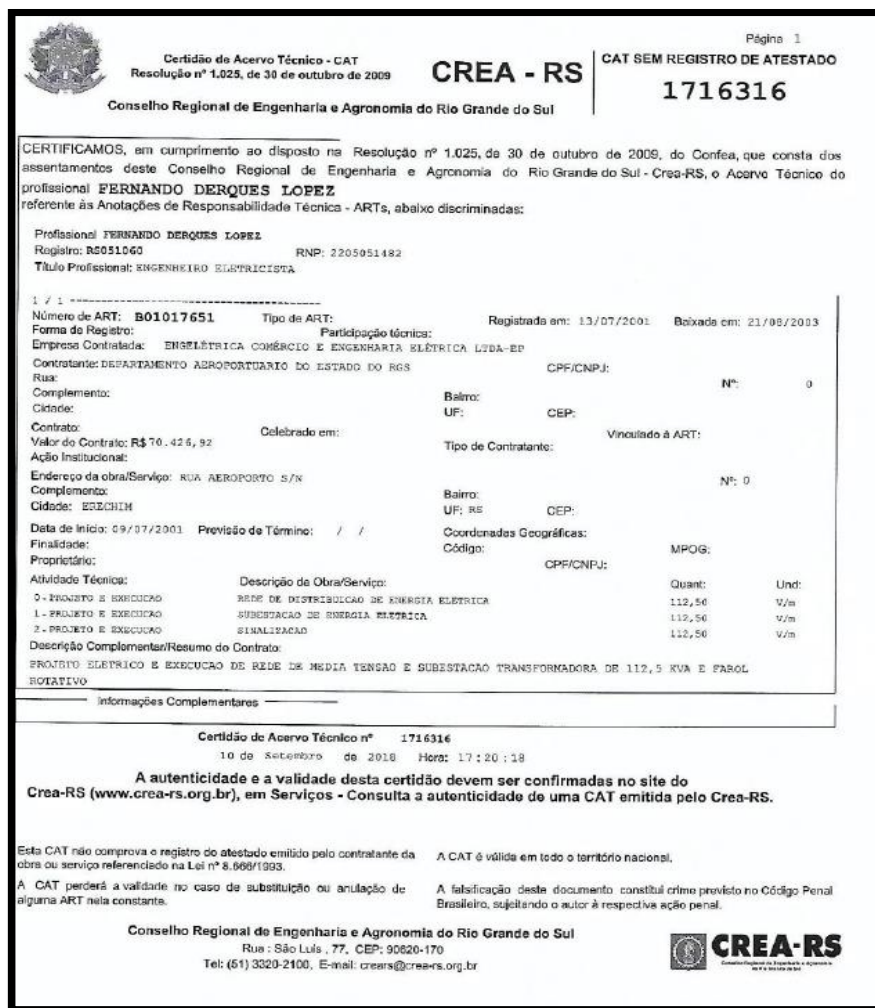
Figura 3 - CAT ausência de informações

A recorrente aponta que o atestado genérico e qualificado para a empresa ENGELÉTRIA ASSESSORIA E ENGENHARIA LTDA, expedido pelo Estado do Rio Grande do Sul por sua Secretaria dos Transportes - Departamento Aeroportuário, não comprova o fornecimento satisfatório do objeto, restando duvidosa a capacidade da vencedora de prestar um serviço de excelência para a Administração Pública, além de ser atinente a empresa diversa da licitante.