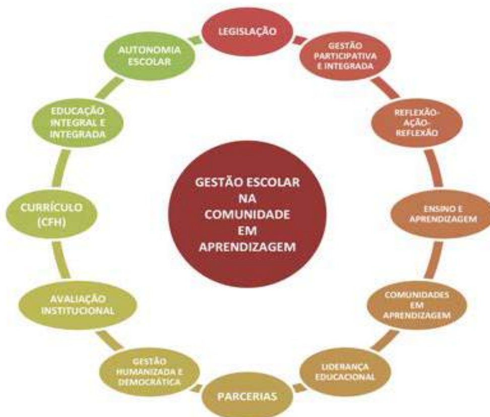
DESENHO 01 – ASPECTOS DA GESTÃO ESCOLAR

No Programa, a gestão escolar é pensada como compromisso coletivo, sendo o gestor o líder responsável pela condução das atividades e processos da instituição escolar, conforme o desenho a seguir: