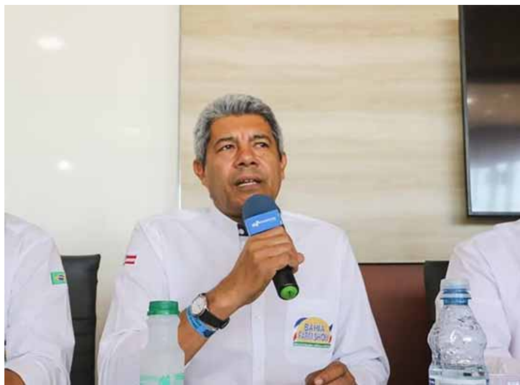
DESDE o anúncio da candidatura de Jerônimo Rodrigues ao Governo em 2022, a legenda recebeu mais de 10 mil novos filiados

“É bom que o prefeito vá trabalhar porque as coisas não estão boas em Salvador. É bom que ele pare de falar de campanha, para de falar de eleição mesmo e vá trabalhar. Tem muita coisa acontecendo na cidade de ruim e ele precisa realmente dedicar