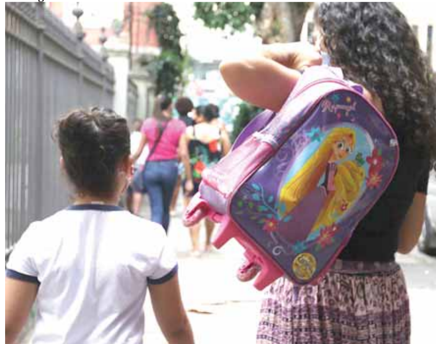
Estados e municípios devem se adequar à escola de tempo integral