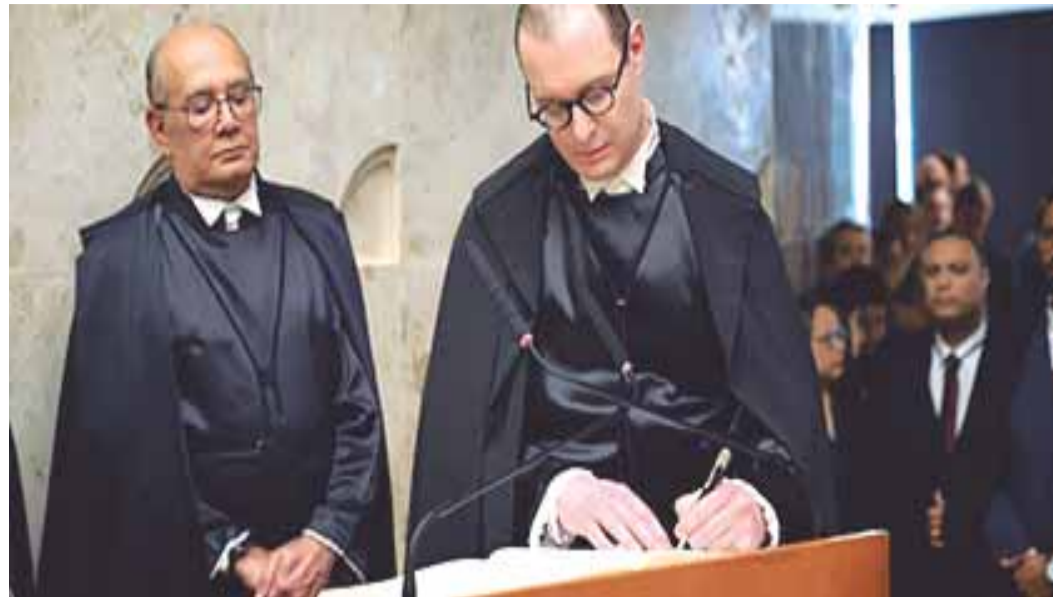
O MINISTRO Cristiano Zanin tomou posse ontem como novo ministro do Supremo Tribunal Federal

Uma vez assumindo o cargo, Zanin passará a fazer