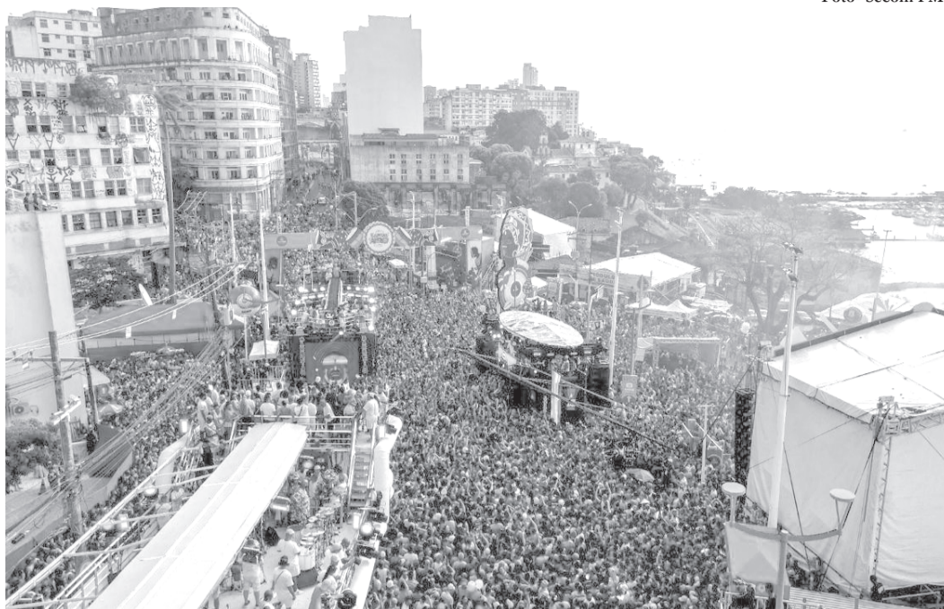
FESTA Uma multidão acompanhou o encontro de trio na abertura do Carnaval da capital

O ato simbólico da entrega das chaves ao Rei Momo ocorreu no Palco Salvador Capital Afro (tema da folia) ao Som da Banda Didá, com a presença de outros blocos afros, do afoxé Filhos de Gandhi, Muzenza, Cortejo Afro. Estiveram presentes o prefeito de Salvador Bruno Reis, o governador da Bahia, Jerônimo Rodrigues, além de diver-