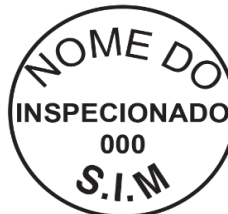
Modelo 3: 4cm de diâmetro