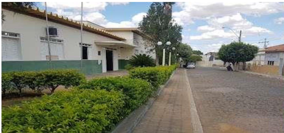
Imagem 3: Praça da Kennedy