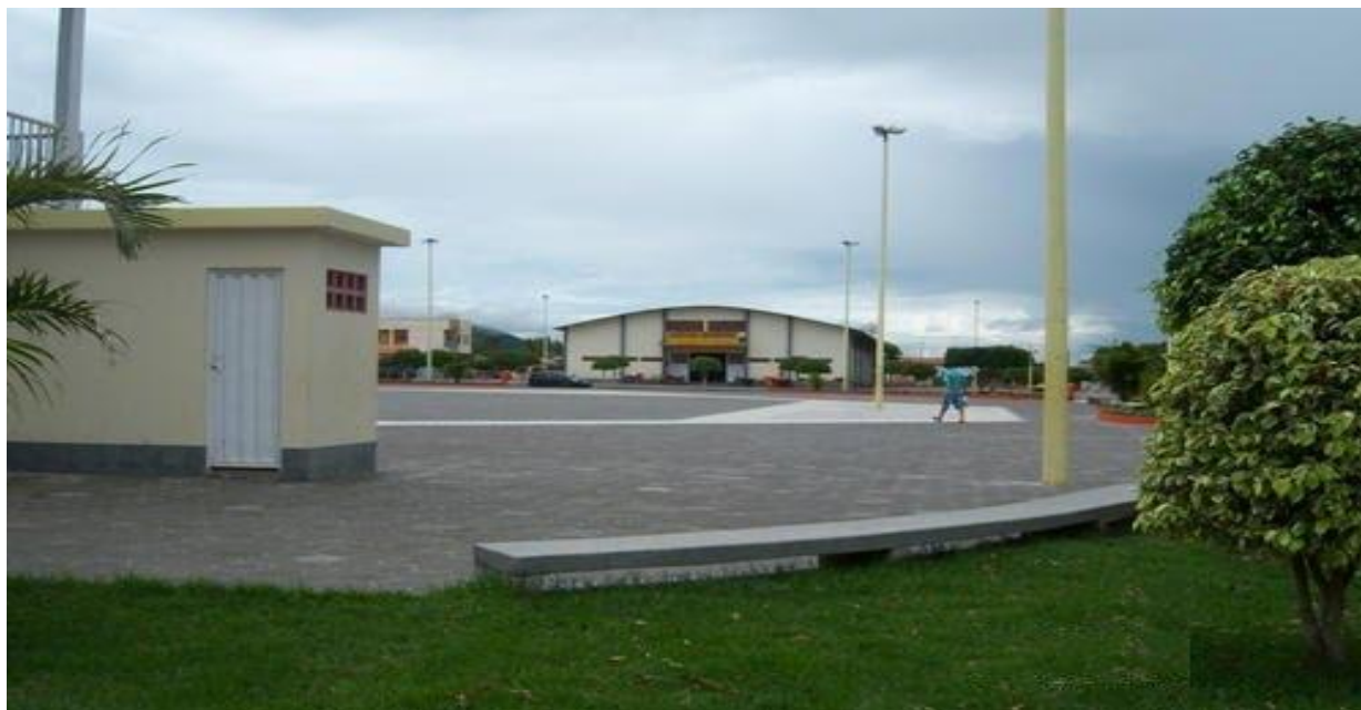
Imagem 2: Praça de eventos