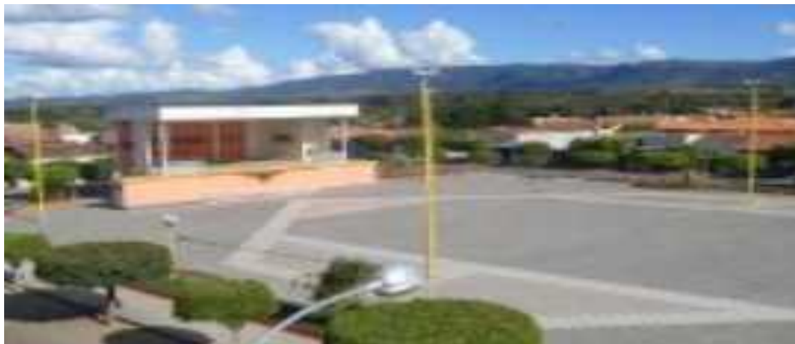
Imagem 2.3: Praça de eventos – árvores a serem decoradas