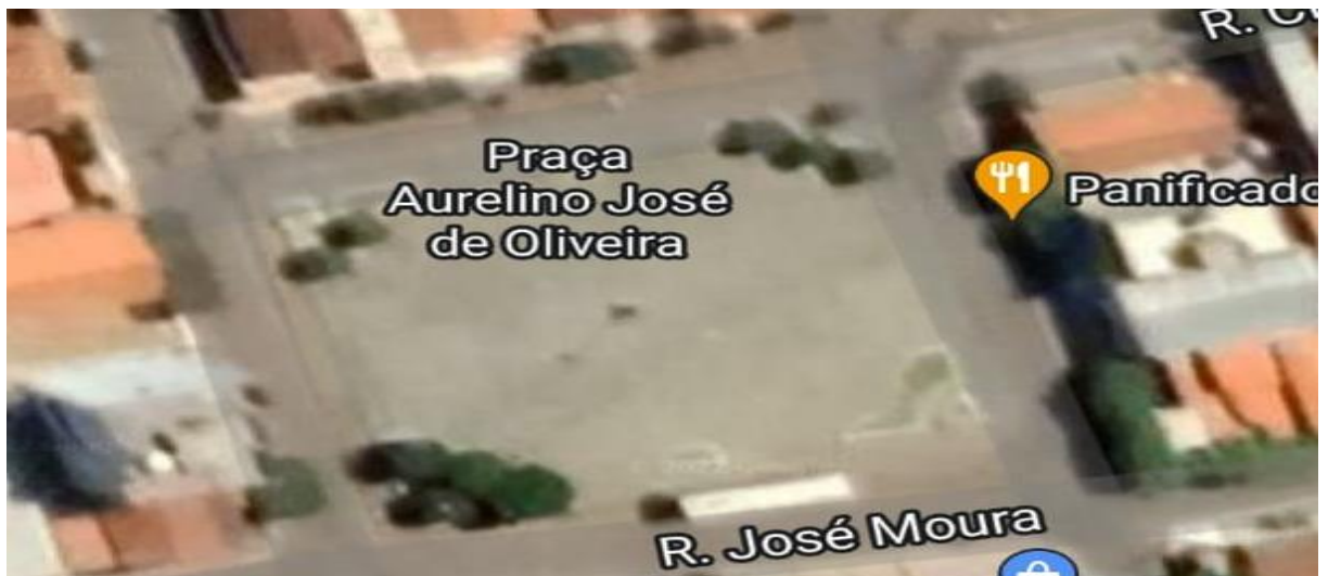
Imagem 5: Praça Aurelino José de Oliveira – Pilões