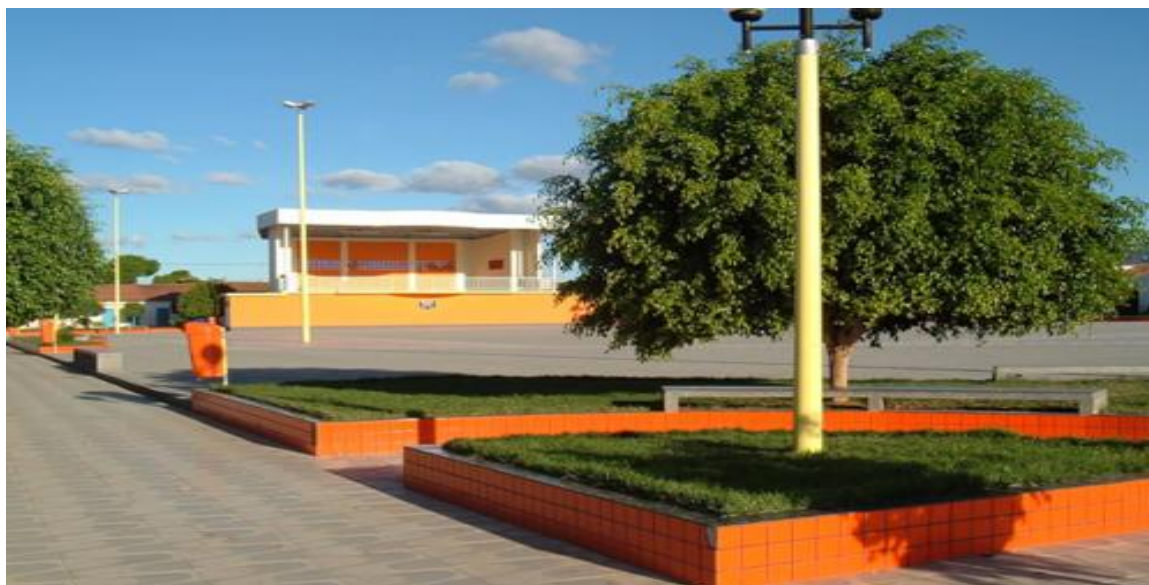
Imagem 2.1: Praça de eventos