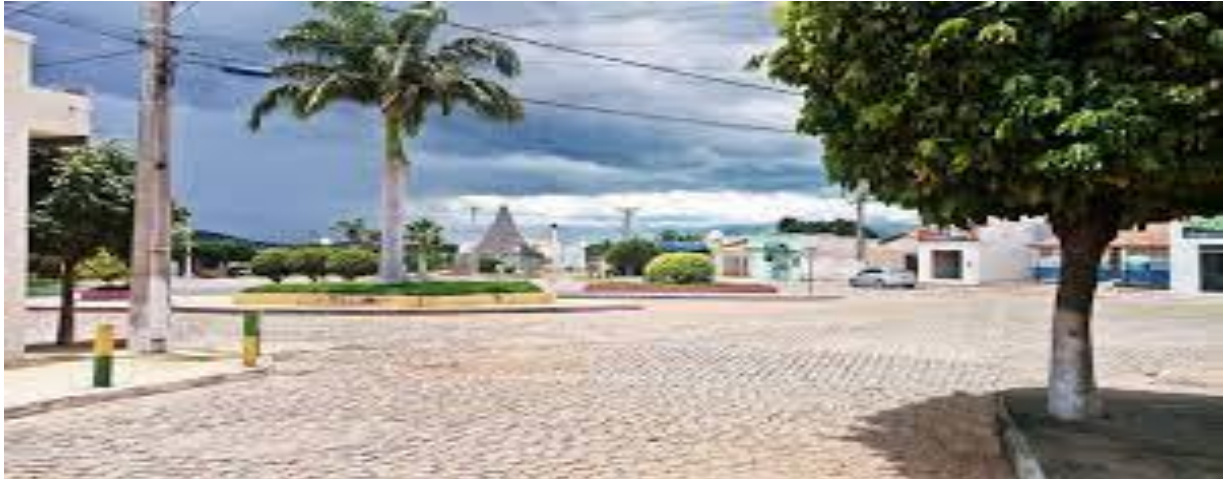
Imagem 4.1: Praça Regina Ana Martins Prado – Pilões