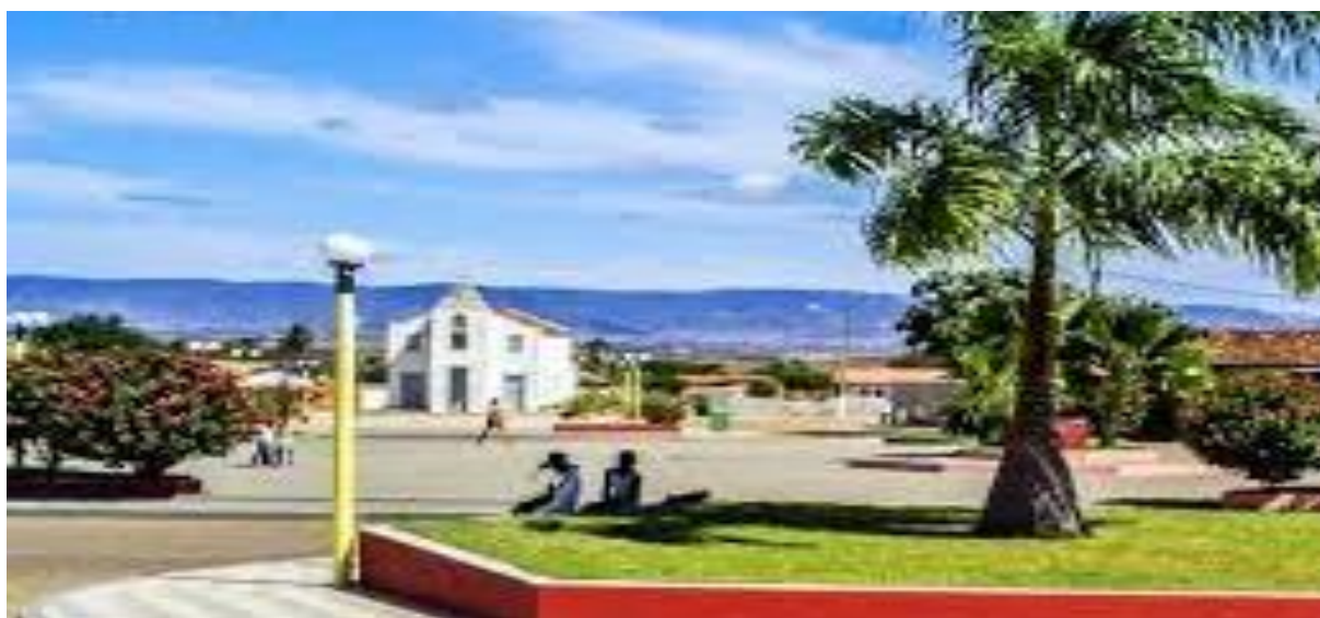
Imagem 4: Praça Regina Ana Martins Prado – canteiros - Pilões