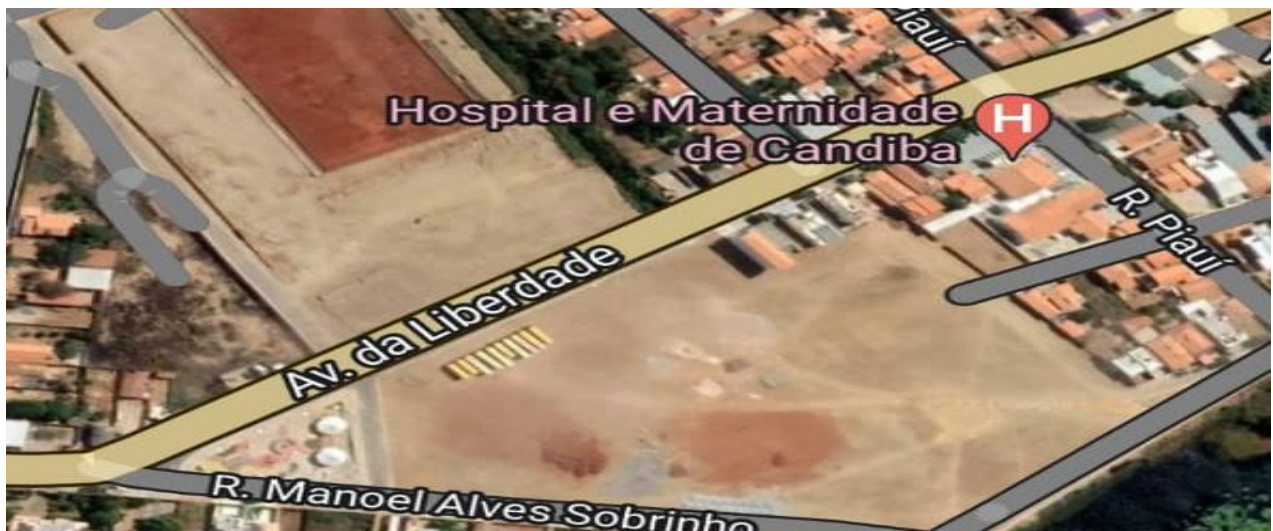
Imagem 7: Avenida da Liberdade –decoreção nos postes - Candiba